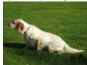
VANGA DU MAS D'EYRAUD 2004-10-08 (F) LOF 178566/34268 (Ch P) - tricolore