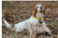
FIERO 1996-08-10 (M) LOI 551356 (Ch ITF, Ch ITT) - lemon