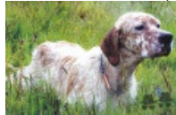
VOIA DU MAS D'EYRAUD 2004-11-27 (F) LOF 178583/34403 (Trialer - Ch A - Clochette de Bronze 2007) - lemon