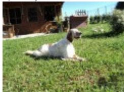
Mère LUNA DES COLLINES DE L'IZARS 2015-02-25 (F) LOF 238136 - lemon